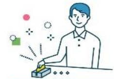
クレジットカード/デビットカード

(原則として、購買金額の5%、フランチャイズチェーン傘下の中小・小規模店舗等では2%を還元)